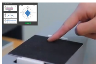
「触感定量化」実験イメージ

あらゆる人の感性をデータとして収集、数値化して一定の指標をつくることにより、多義語で表現されやすい感覚や印象を一般化する「感性のものさし」の研究について紹介します。このゾーンでは、ものの印象を評価する実験と、触覚をデータ化する「触感定量化」実験へ参加できます。また「感性のものさし」を組み込んだ「感性 AI エンジン」をファッションの分野に応用したアプリ「COUTURE」を紹介します。感性を客観的に数値化することで、一人ひとりの感性に「ぴったり」のモノが作れる未来はそう遠くはないでしょう。