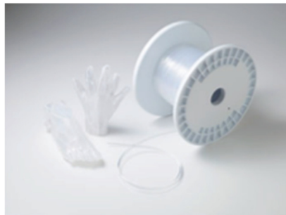
新素材「FABRIAL」と造形品の例