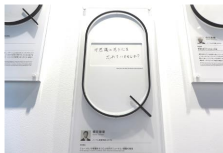
ノーベル賞受賞者のメッセージパネル