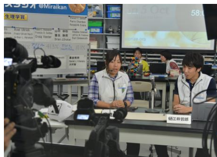
「ノーベル賞発表の瞬間をみんなで迎えよう」 (昨年の放送の様子)

番組視聴 URL: http://live.nicovideo.jp/watch/lv274706204