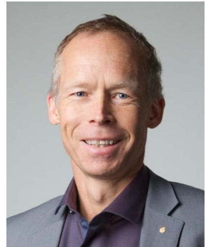
ヨハン・ロックストローム氏

※本講演は、つながりプロジェクト「地球合宿2015—テクノロジーで人類を守るか!？」の一環として開催されます。