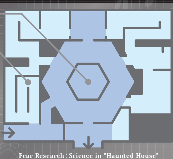
Fear Research : Science in "Haunted House"

心霊写真、降霊術、背後霊、幽体離脱、第六感…。いわゆる超常現象の中には、脳科学で説明できるものがありました。科学が発達した現代の私達を、もいまだに怖がらせる、お化けの存在に迫ります。