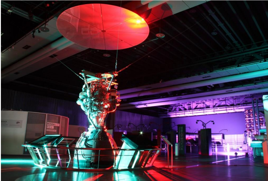
常設展示「H-IIA ロケットエンジン」のライトアップ