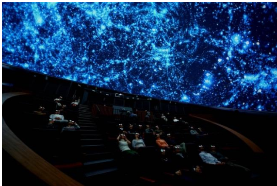
ドームシアター内観

お申し込みはこちらから: http://www.miraikan.jst.go.jp/event/1705101021343.html