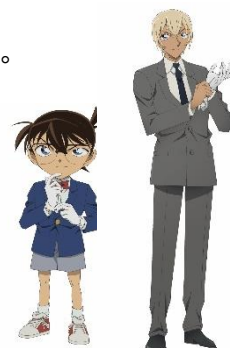
探偵手帳に登場する 江戸川コナンと安室透

会場内にあるコナンの仲間たちの力を借りて、容疑者にされてしまった小五郎の疑いを晴らすコースです。参加者は探偵であるコナンと小五郎の娘である蘭と一緒に、事件当日に何が起こったのかを明らかにします。