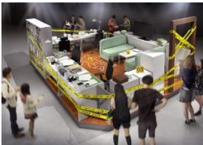
「現場検証エリア」イメージ

現場検証エリアや聞き込みエリアで集めた手がかりを科学の力で分析します。文書鑑定や成分分析、指紋鑑定などの鑑定技術の特性を理解しながら、うまく技術を組み合わせ、確かな証拠をつかんでいきます。