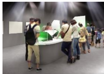
「ラボエリア」イメージ