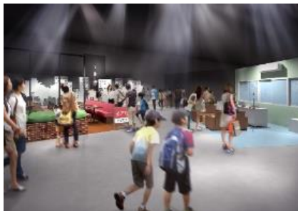
「聞き込みエリア」イメージ