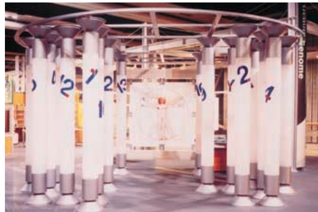
【解説】ヒトの染色体は一種類2本ずつ22種類の常染色体と、男性・女性を決める2種類の性染色体があり、性染色体を1つのボールにしているの、ボールは全部で23本です。

新春クイズラリーは、1月2、3日の2日間で1000名を超える参加者がありました。問題はボランティア・インタープリターの協力で作成し、どんどん質問して答えを探す内容です。例えば、生命の科学と人間5Fの「ゲノムハーブのボールの数は？」は、子供がボールを数えればわかりますが、答えの23本はヒトの染色体をイメージしたものでした。「だったら46本では？」という方とはさらに会話が進みました。次回を企画中です。ぜひご参加ください。